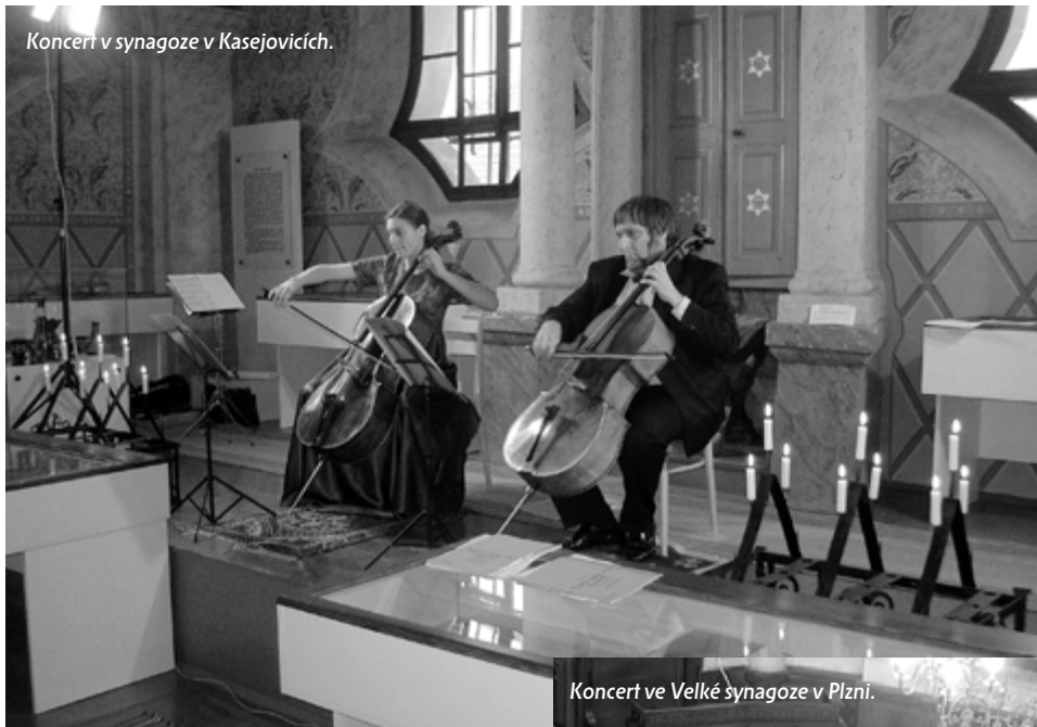
Koncert v synagoze v Kasejovicích.

Obecně prospěšná společnost Úhlava z Klatov připravuje už třetím rokem, s podporou Nadačního fondu obětem holocaustu, cyklus benefičních koncertů v synagogách Plzeňského kraje. Koncerty se již uskutečnily ve velké synagoze v Plzni, v synagoze v Kdyni, v Radnicích, v Kasejovicích, ale také například v Muzeu Šimona Adlera v Dobré Vodě. Výtěžek z koncertů a přednáškové činnosti jsou každý rok věnovány na opravu Staré synagogy v Plzni.