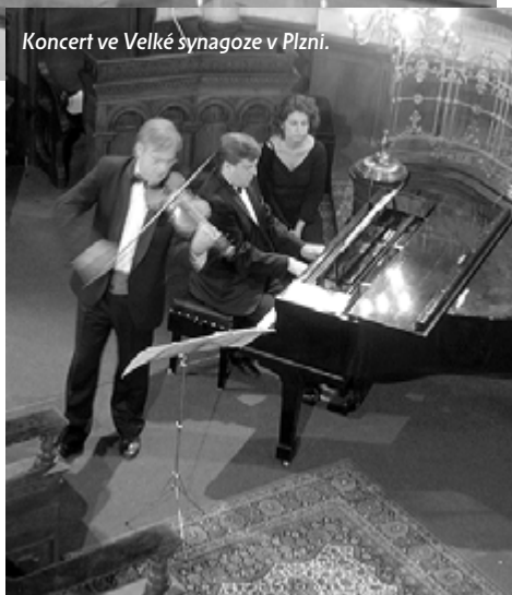
Koncert ve Velké synagoze v Plzni.

Více informací o projektu můžete získat na internetových stránkách www.uhlava.cz .