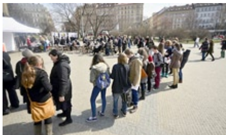
Foto na titulní straně: Jom ha-šoa, Praha, 8. 4. 2013