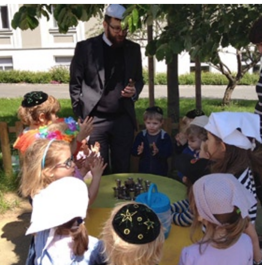
Předškolní zařízení Bejachad