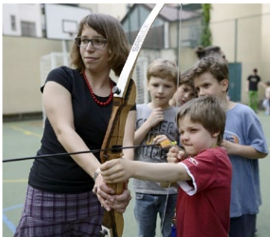
Oslava svátku Lag ba-omer v Lauderových školách

V podprogramu zaměřeném na mladé židovské rodiny jsme podpořili 9 projektů, jedná se o vzdělávací projekty židovských komunit, spolků a školy a také o projekt Federace židovských obcí v ČR Limmud, několikadenní vzdělávací setkání zejména židovských rodin s dětmi z celé České republiky.