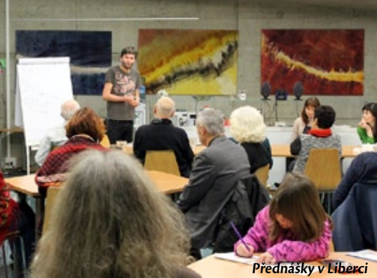
Přednášky v Liberci

Velké synagoze v Plzni připomínku lednových transportů a také Spolek na obnovu židovských památek na Perucku vybudoval obětem šoa důstojný památník na tamním židovském hřbitově. Díky naší podpoře byly vydány čtyři publikace, o kterých jsme vás již podrobněji informovali v minulých číslech InfoBulletinu. Financovali jsme také pokračování či vznik nových výstav, jako např. výstavu fotografií Židé v Teplicích, kteří přežili holocaust, kterou připravila Židovská obec Teplice. Dále jsme podpořili výrobu dokumentárního filmu „32 utajovaných stran“ o strastiplném útěku dvou vězňů Alfreda Wetzlera a Rudolfa Vrby z vyhlazovacího tábora v Osvětimi a také pět badatelských projektů.