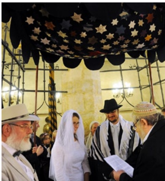
Svatební pár pod chupou

Aby se snoubenci symbolicky připojili a zanechali stopu po své svatbě, připevní po obřadu na