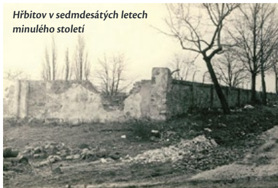
Hřbitov v sedmdesátých letech minulého století

Tehdejší Okresní národní výbor Břeclav a Místní národní výbor Hustopeče však jedinou alternativu řešení spatřovaly v prosazování likvidace pohřebiště. Na přelomu sedmdesátých