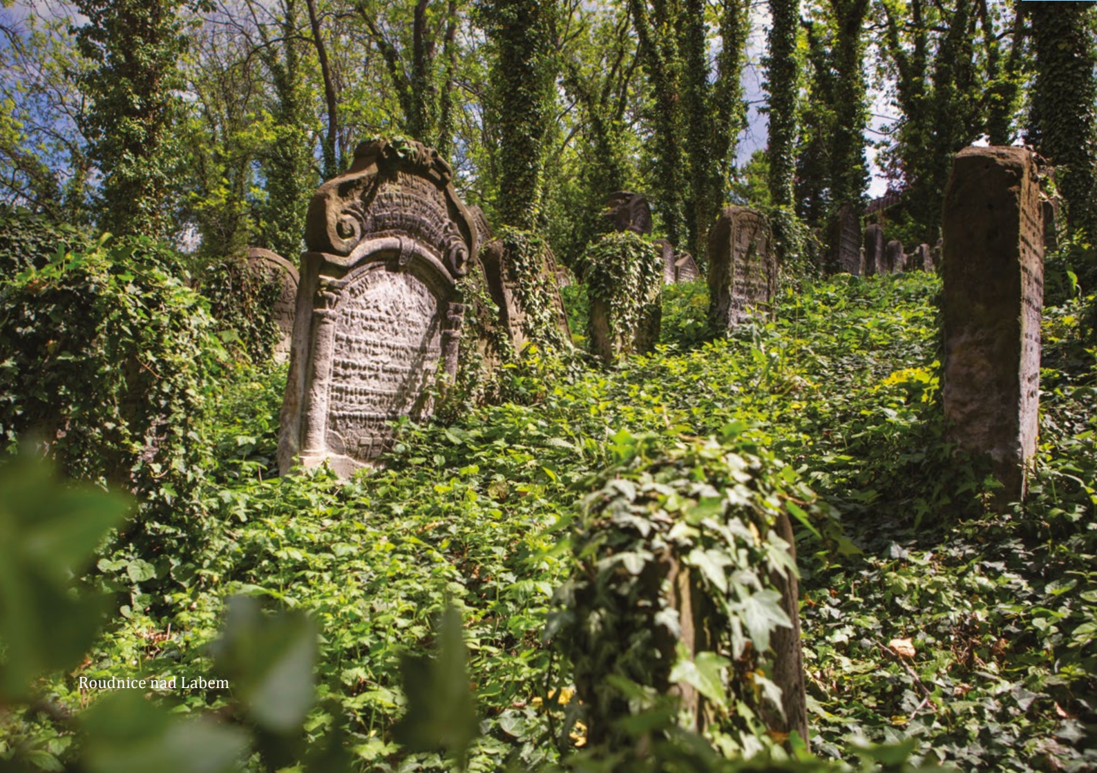
Roudnice nad Labem