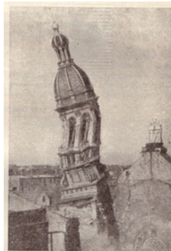
Obr. 118. Odstřel věže vinohradské synagogy v Praze