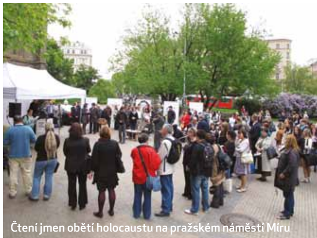
Čtení jmen obětí holocaustu na pražském náměstí Míru

NFOH byl založen 31. 7. 2000 na základě doporučení „Smíšené pracovní komise zabývající se problematikou zmírňování některých majetkových křivd způsobených obětím holocaustu“.