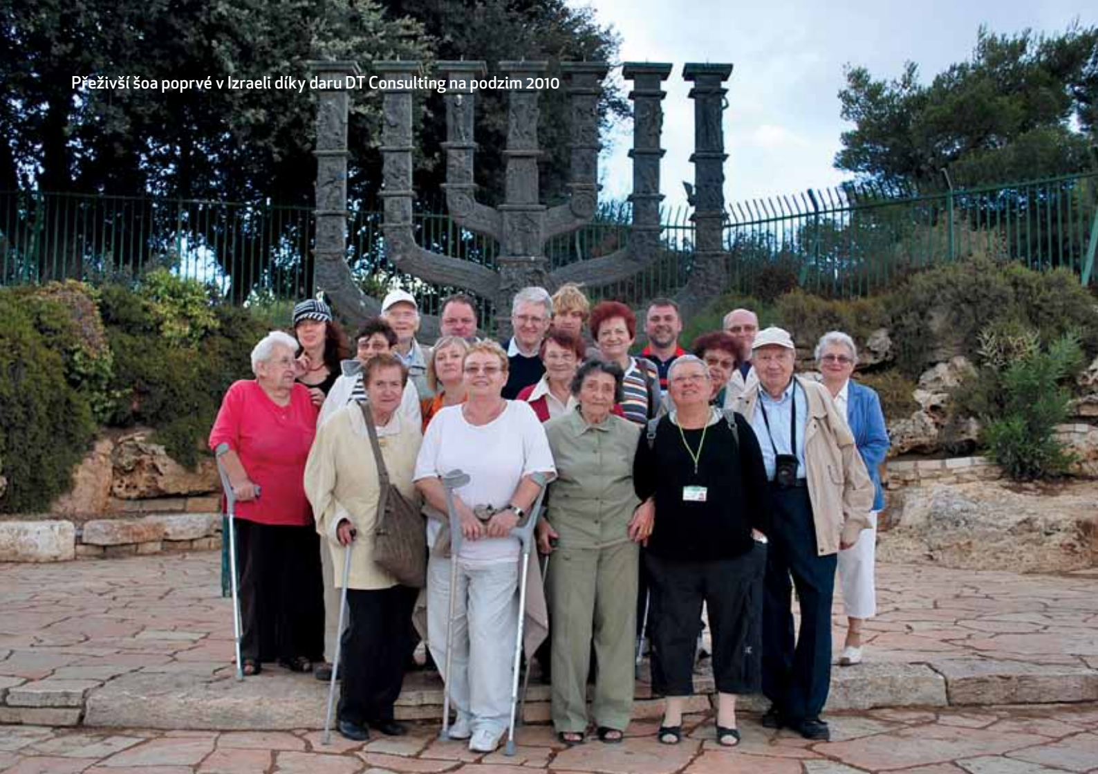
Přeživší šoa poprvé v Izraeli díky daru DT Consulting na podzim 2010