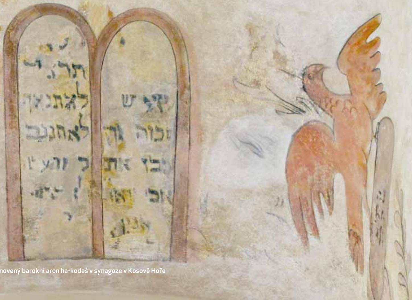
Obnovený barokní aron ha-kodeš v synagoze v Kosově Hoře