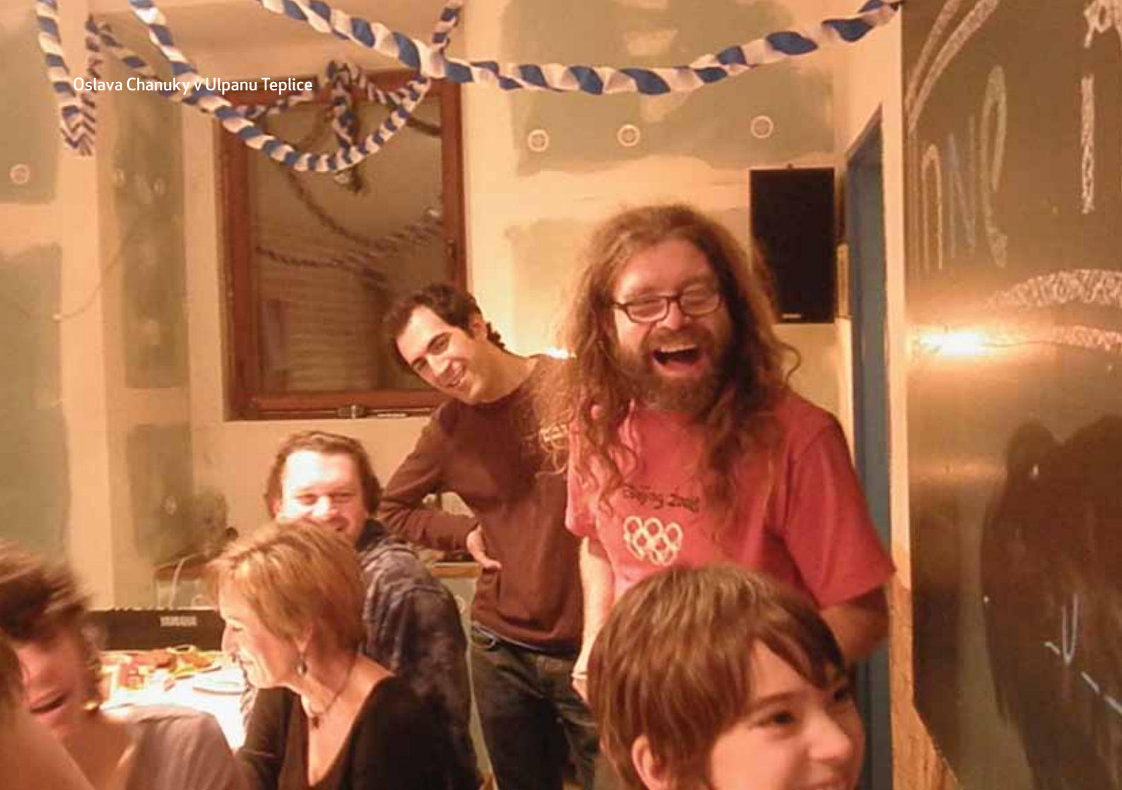
Oslava Chanuky v Ulpanu Teplice