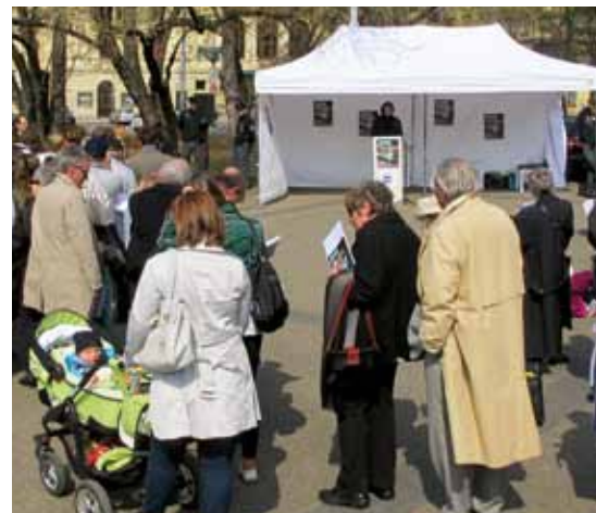
Čekání na čtení jmen obětí šoa

Na Jom ha-šoa (Den holocaustu podle židovského kalendáře) každý rok pořádáme spolu s Institutem Tereziánské iniciativy veřejné čtení jmen obětí holocaustu na pražském náměstí Míru. V roce 2012 připadl tento den na 18. dubna a k veřejné připomínce obětí šoa se připojily nejen významné osobnosti veřejného života, ale i desítky obyčejných lidí.