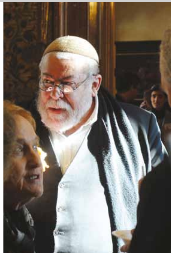
Vrchní zemský a pražský rabín Karol Efraim Sidon v Senátu 27. ledna 2012

NFOH se aktivně účastní podpořených projektů, v případě zájmu pomáhá s jejich propagací, pravidelně o nich informuje.