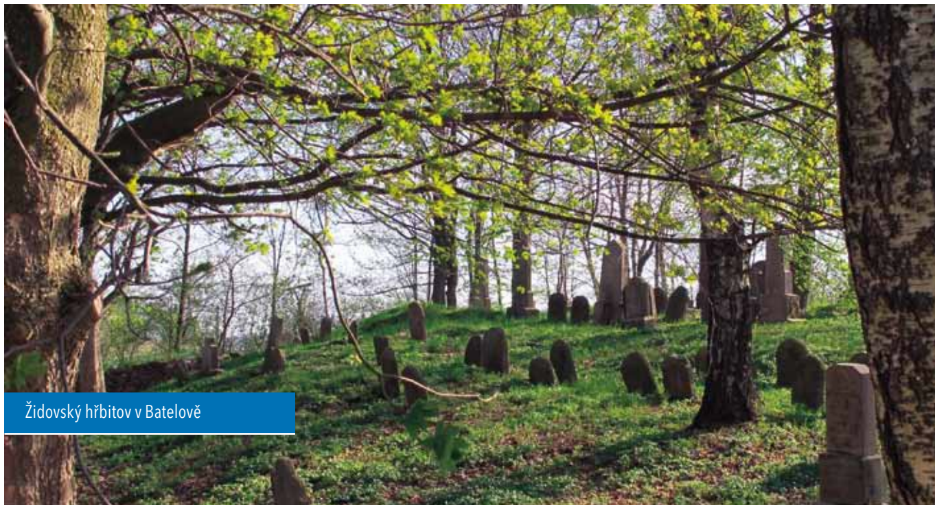
Židovský hřbitov v Batelově