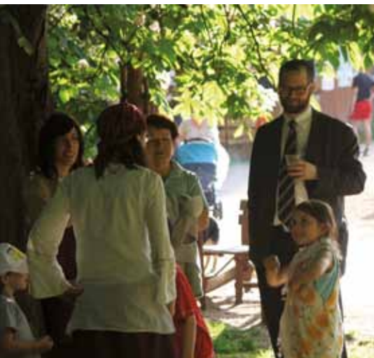
Oslava svátku Lag ba-omer, Chinuch a Klub Gešer

F inancujeme vzdělávání v judaismu a rozvoj židovských komunit. Podporujeme projekty, které pomáhají předávat židovskou tradici, programy židovských školek a škol, přednášky, semináře a workshopy, měsíčníky a zpravodaje židovských organizací, festivaly židovské kultury a další.