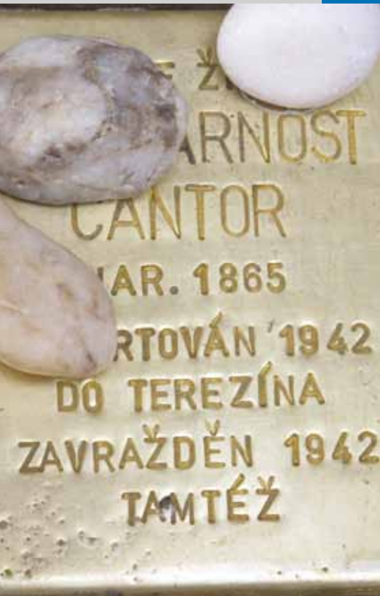
Kameny zmizelých, Stolpersteine CZ

Podporujeme projekty, které důstojně připomínají židovské i romské oběti holocaustu. Naší prioritou jsou projekty zaměřené na vzdělávání mládeže, studentů základních a středních škol a zejména odborně vedené aktivity, do kterých jsou zapojeni pamětníci šoa. Přispíváme na nejrůznější vzpomínkové akce a pietní akty, pamětní desky a památníky, výstavy, přednáškové činnosti, workshopy, výzkumné práce či vydávání tematických knih a publikací. Celkem jsme v roce 2012 podpořili realizaci 21 projektů, kterým jsme vyplátili nadační příspěvky ve výši 423 505 Kč. Současně ve třech případech byla vrácena část nevyčerpaných příspěvků z grantového kola předešlého.