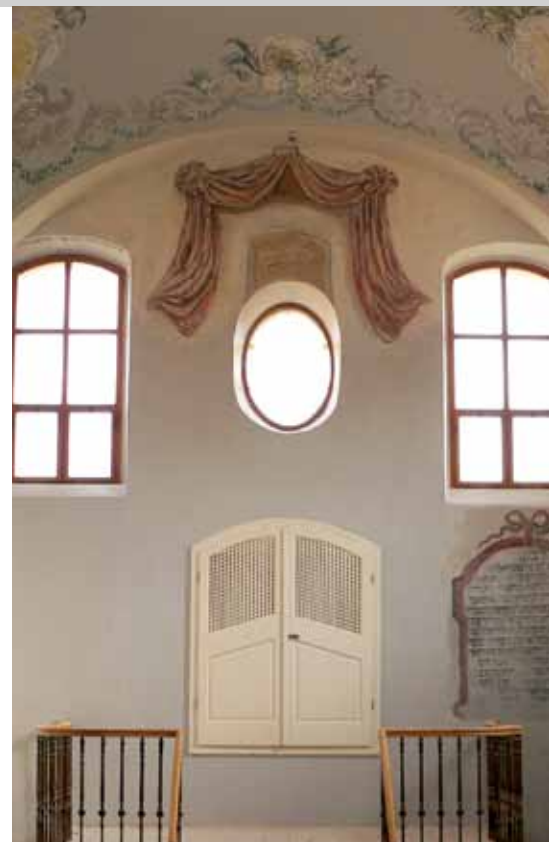
Obnovený interiér synagogy v Úsově

Financujeme zejména opravy synagog, rabínských domů a židovských hřbitovů, zde především restaurování cenných náhrobních kamenů, obnovu původních ohradních zdí, případně obnovu hřbitovních domků. Nově podporujeme také dokumentaci náhrobníků. V roce 2012 naši podporu získalo celkem 14 projektů v celkové výši 6 750 000 Kč.