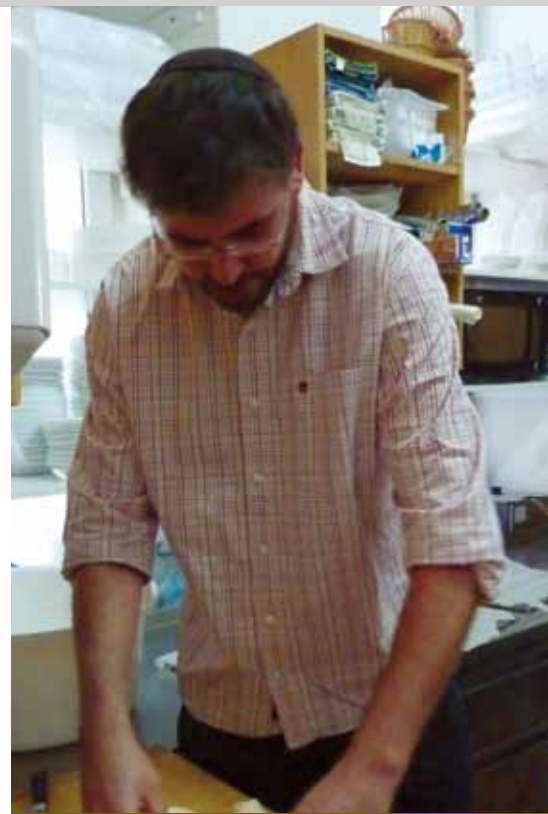
Den otevřených dveří na Židovské obci v Olomouci

Židovská obec v Praze nám v roce 2012 udělila další mimořádný dar ve výši 500 000 Kč na podporu mladých židovských rodin za účelem rozvoje židovské komunity v České republice. Za tímto účelem jsme založili podprogram Naše Budoucnost, v jehož rámci správní rada vybrala 10 projektů pro podporu v roce 2013 v celkové výši 237 500 Kč. Podprogram Naše Budoucnost bude vyhlášen rovněž pro rok 2014.