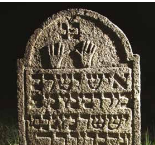
Náhrobek na židovském hřbitově v Nové Cerekvi