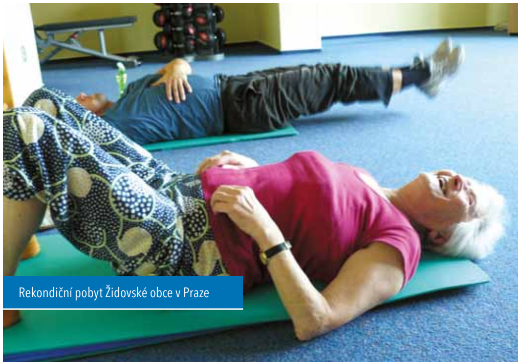
Rekondiční pobyt Židovské obce v Praze