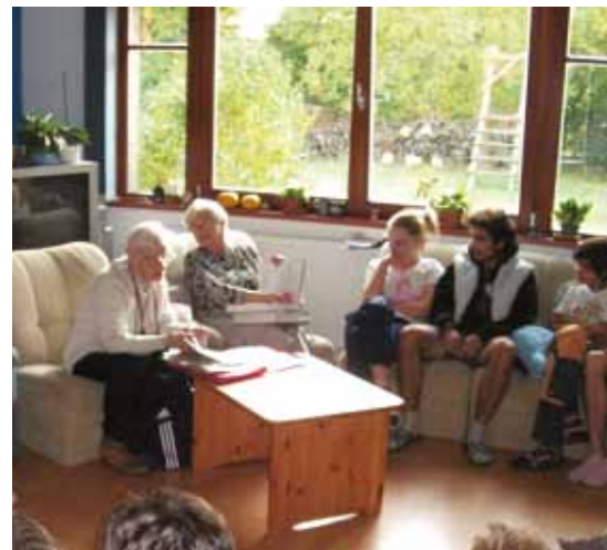
Beseda s pamětníci, Diagnostický ústav Dobřichovice